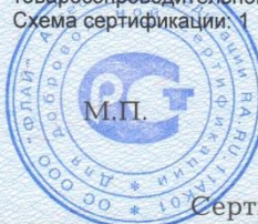
Схема сертификации: 1

Условия хранения продукции, срок хранения (службы, годности) указан в прилагаемой к продукции товаросопроводительной и/или эксплуатационной документации.